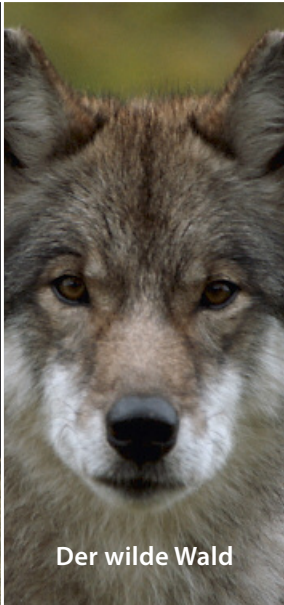
Der wilde Wald